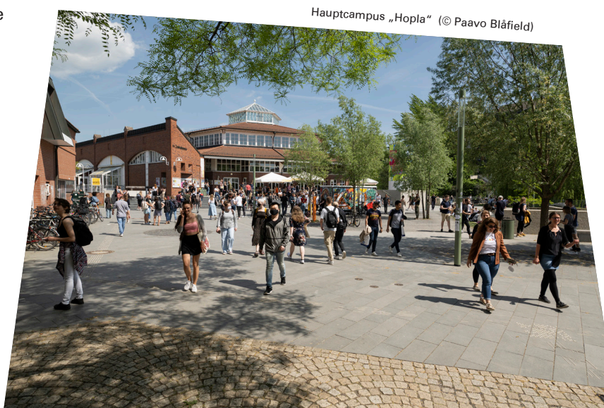
Hauptcampus „Hopla“