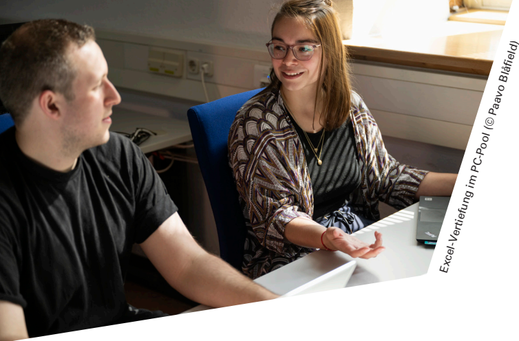
Excel-Vertiefung im PC-Pool