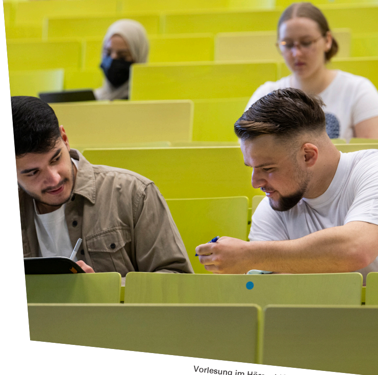
Vorlesung im Hörsaal