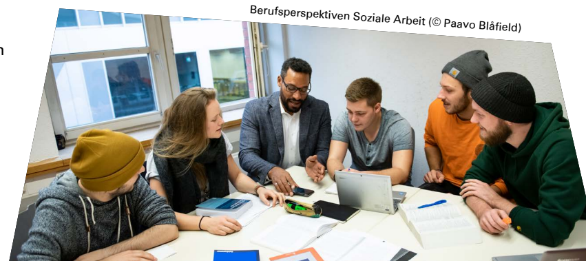
Berufsperspektiven Soziale Arbeit