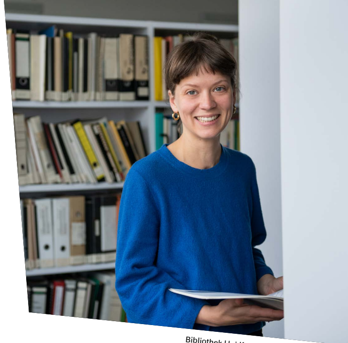
Bibliothek Uni Kassel

Neben der Einführung in die Geschichte, Theorien, Konzepte, Methoden und ethischen Grundlagen der Sozialen Arbeit werden Grundlagen der Erziehungswissenschaft, Soziologie, Psychologie, Politikwissenschaft und Rechtswissenschaft vermittelt. Die Studierenden werden dazu befähigt, wissenschaftliches Wissen mit professioneller Praxis zusammenzubringen und somit reflexiv und gesellschaftskritisch Problemlösungen in den Handlungsfeldern der Sozialen Arbeit zu entwickeln. Je nach Interesse können die Bereiche Bildung, Erziehung, Therapie, Rehabilitation und soziale Hilfen vertieft werden. Einen wichtigen Beitrag zur Berufsorientierung leistet die umfassende Praxisphase (Berufspraktische Studien). Die Hälfte dieser Praxisphase kann mit einem Forschungsschwerpunkt absolviert werden (Lehrforschung). Die in Hessen für die staatliche Anerkennung als Sozialarbeiter:in erforderlichen weiteren Praxiszeiten werden postgradual, also nach dem Bachelor-Abschluss, absolviert.